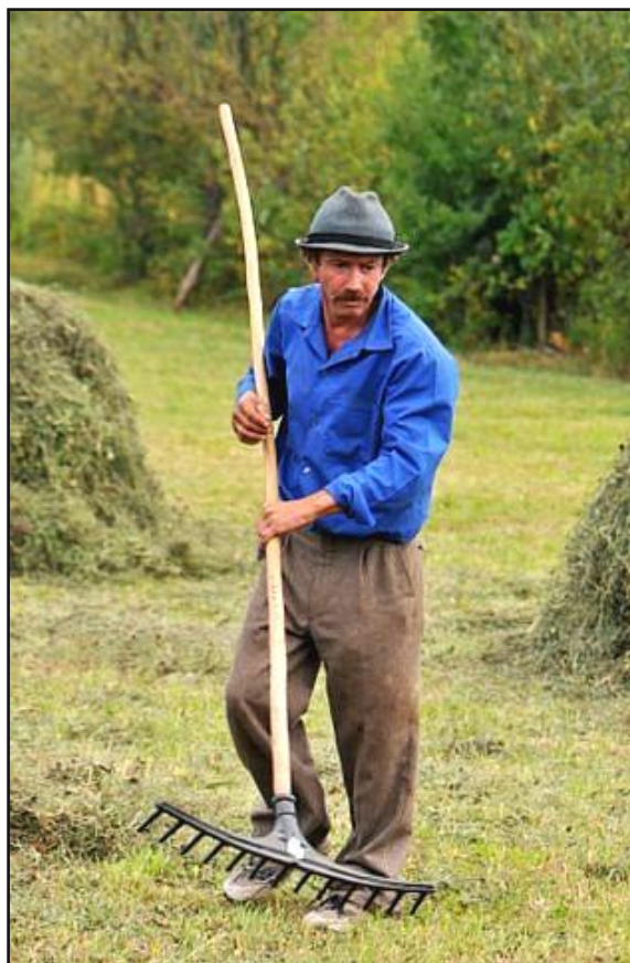
Foto: Dr. K.-H. Richter - aus der Rumänien-Ausstellung (Original farbig)

04.02. - 03.03.11 Neuenmarkt idea- Schmetterlingsparadies 100 Bilder des Jahres 2009