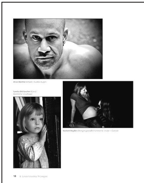
Eine Seite aus dem Katalog.

Der Fotoclub Themar, der Ausrichter der diesjährigen Landschaftsfotografie, hat die Jurierung am 4. Februar sehr gut vorbereitet. Vielen Dank dafür!