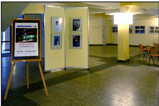
Blick in die Ausstellung in Berlin

vom 18.02. bis 24.03.2017 in Berlin- Marzahn (FreizeitForum)