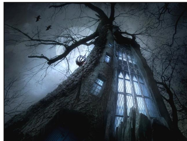
Das Foto " Hochstamm " von Frank Melech (Suhl) gehört zu drei Bildern des Autors in der 8. LandesFotoSchau Thüringens. Er bekam dafür einen der drei Preise.