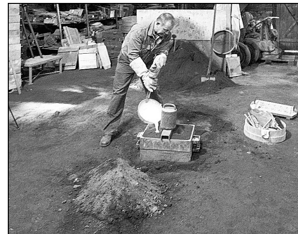
Schaugießen in der Heinrichshütte Wurzbach