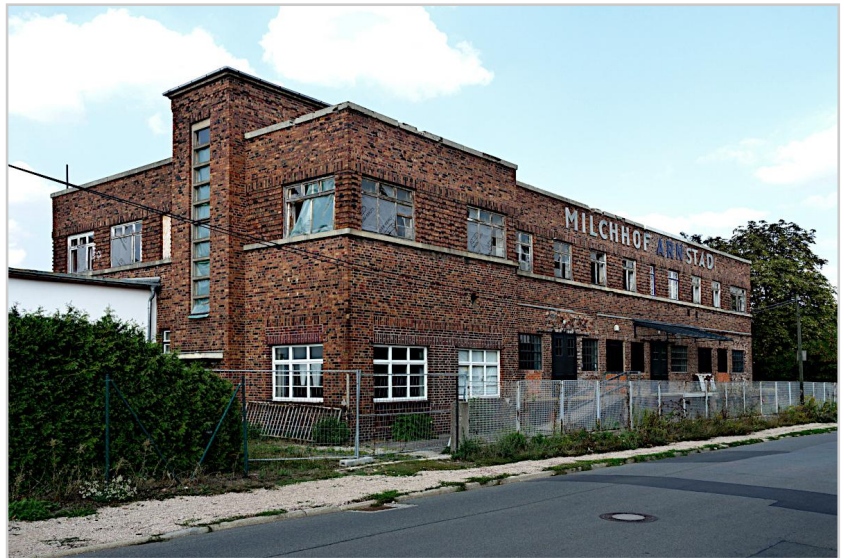
Milchhof Arnstadt , eines der wichtigsten Gebäude der Moderne in Deutschland – Ziel unserer Fotoexkursion