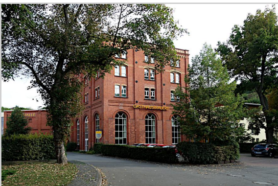
Treffpunkt für den diesjährigen Fototag: Stadtbrauerei Arnstadt