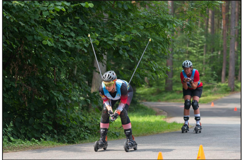
Fünf Fotograf(inn)en der Gff nutzten die Gelegenheit, im Juli bei Cross-Scating-Biathlon in Frankenhain zu fotografieren. Eine Galerie mit 30 Fotos finden Sie auf unserer Webseite.