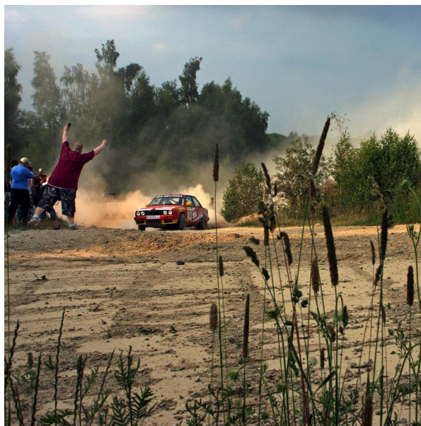
"biggest Fan" von Katja Wisotzki