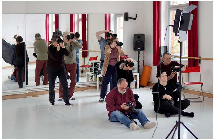
Bild rechts: Fotografinnen und Fotografen beim Ballett-Fotoshooting

verboten: Erzeugung von Bildern ausschließlich mit Hilfe von Software über Eingabe sogenannter Prompts („generative KI“)