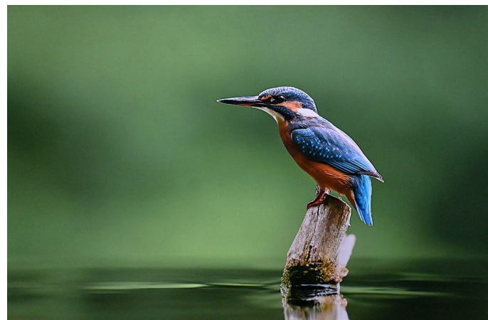
3. Platz (52 Punkte) Michael Ritter (Fotoclub Kontrast Suhl) "Auf der Lauer"