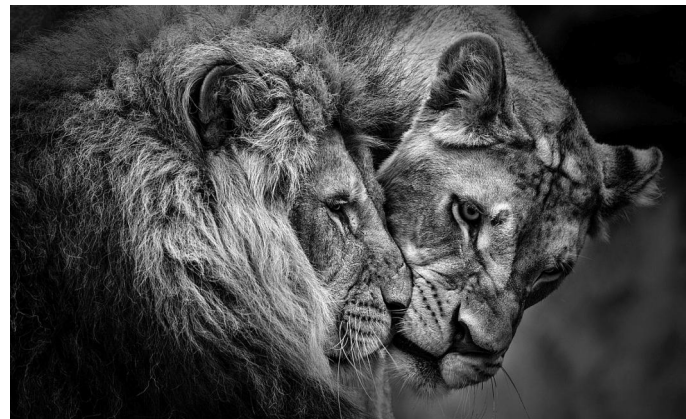
1. Platz (55 Punkte) Jürgen Müller (Fotoclub Reflexion '90 Erfurt) "Vertraut"