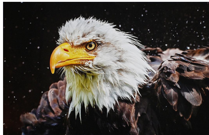
2. Platz (53 Punkte) Christel Trica (FOTO-Klub JENA '78) "Frisch geschmückt"